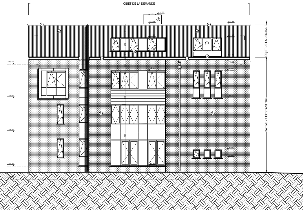
Situation projetée - Elévation est