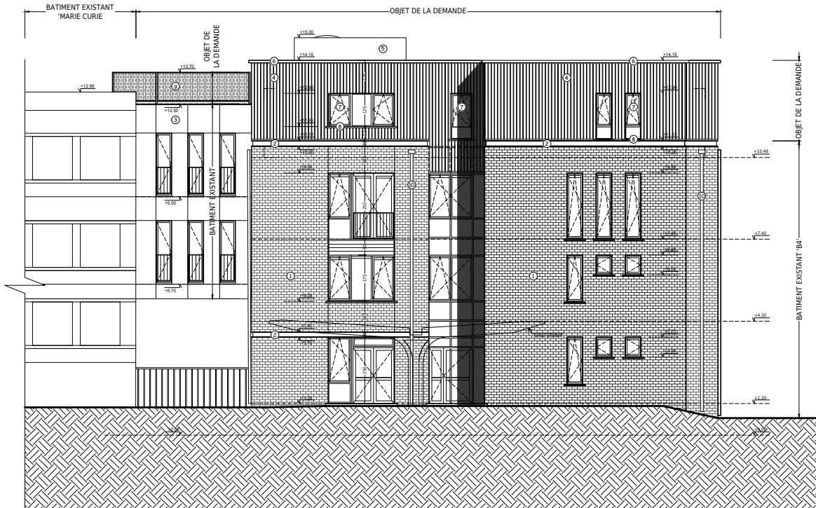
Situation projetée - Elévation sud